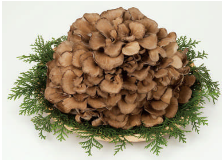
※『雪国まいたけ 極 ひと株』がもらえるギフト券をプレゼント！

会場で配布するパンフレットに、戸越銀座内に設置された3種類のスタンプを集めた方全員を対象に、ギフト券や雪国まいたけ商品詰め合わせセットなどが当たるガラポン抽選会を実施致します。