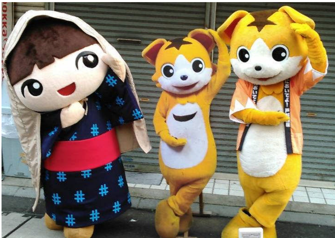
※戸越銀次郎×雪ちゃんの夢のコラボ再び！(昨年の戸越銀座フェアより)

また、キックオフイベントの15日木曜日には商店街で「飲み歩き・食べ歩きイベント 「戸越銀座きのこバル」・18日日曜日はフィナーレイベント「雪国まいたけ極味噌汁の無料試食」をメイン会場の「戸越公園」などで開催予定です。